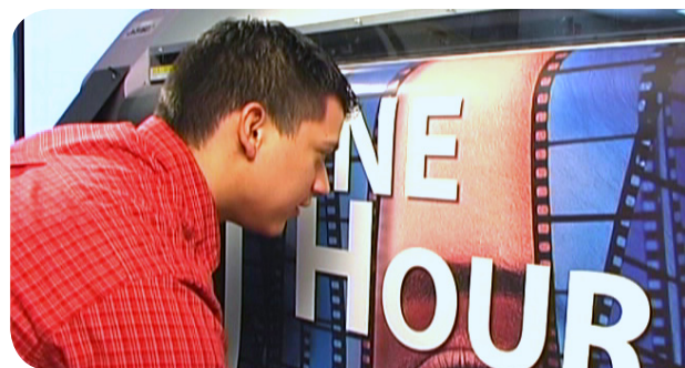
Imprimez sur une imprimante à jet d'encre aqueux ou à solvant d'entrée de gamme.