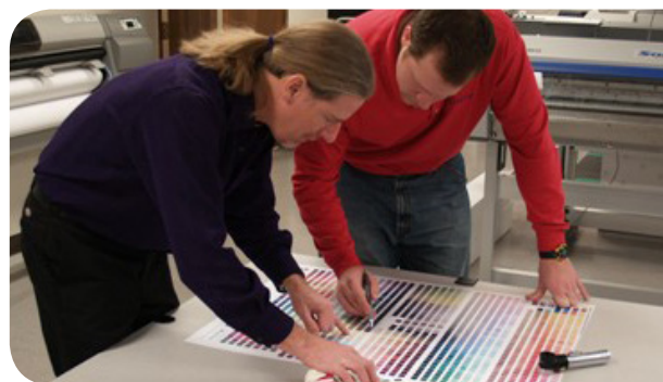
Grâce au générateur de profils « Print, Read, Next », vous gardez la maîtrise parfaite de votre budget encres et consommables.