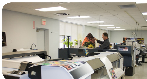
Imprimez sur 4 imprimantes : jet d'encre aqueux, solvant d'entrée de gamme, solvant grand format ou UV à plat.