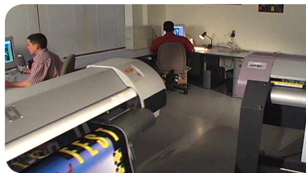
Avec PosterShop, pilotez jusqu'à 2 imprimantes tout en conservant des couleurs et un flux de production stables tout au long de votre chaîne graphique.