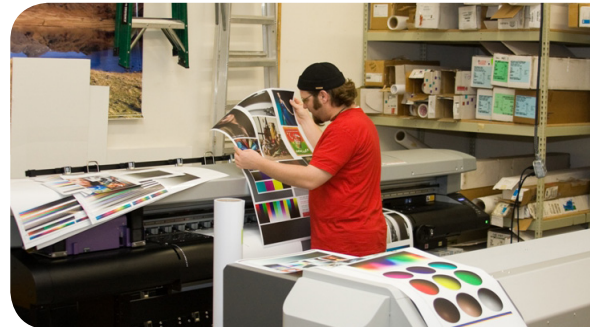
Imprimez sur 2 imprimantes : jet d'encre aqueux, solvant d'entrée de gamme, solvant grand format ou UV à plat.