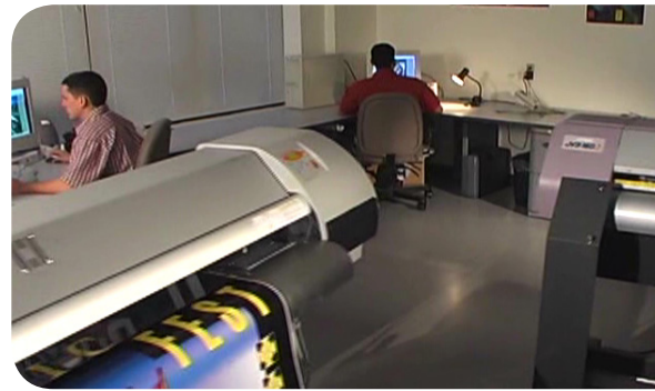
PosterShop vous permet d'exploiter 2 imprimantes actives.